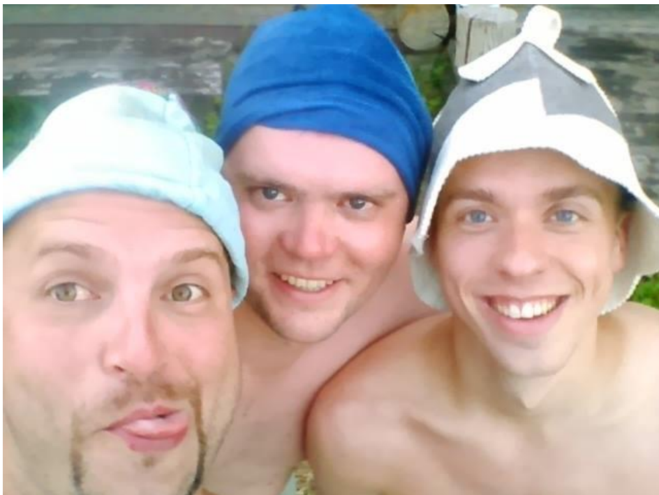
Ég með rússneskum félögum mínum

Eftir Kúbu fór ég svo til St.Pétursborgar þar sem ég tók þátt í lokuðum GM-flokki. Undirbúningur fyrir mótið fólst í því að fara í saunu þar sem ég var látinn afklæðast og laminn í mínútu með trjágreinum sem höfðu verið látnar liggja í heitu vatni, (að rússneskum sið var mér sagt), og fékk ég að vera með kjánalega húfu á meðan sem gerði barninginn aðeins bærilegri. Mótið gekk því miður ekki mjög vel þrátt fyrir að ég hafði lagt miklar vonir við undirbúninginn.