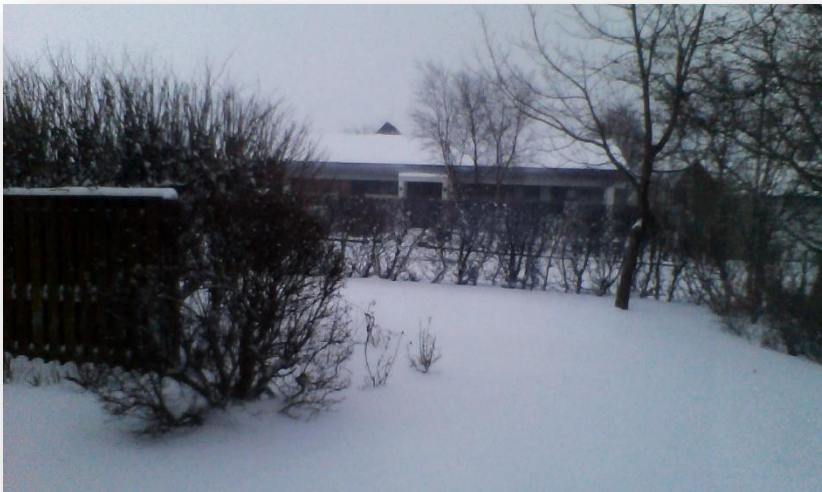
Heima er best!

Svo tók við 24klst. ferðalag heim og var ég kominn á aðfangadagsmorgun og fór beint að sofa.... svo var ég reyndar vakinn til að moka snjó og hjálpa mömmu að ýta bílnum, en það er önnur saga!