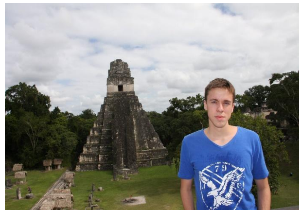
Tikal rústirnar frægu í norður Guatemala

... og svo til Belize þar sem ég endaði á einhverri eyju í karabíska hafinu. Ég var reyndar búinn að láta mig dreyma um að fara til Belize síðan fyrir árinu áður þegar ég sá myndir þaðan og eftir að hafa snorklað með hákørlum og skjaldböfum verð ég segja að það var líklega magnaðasti partur allrar ferðarinnar.