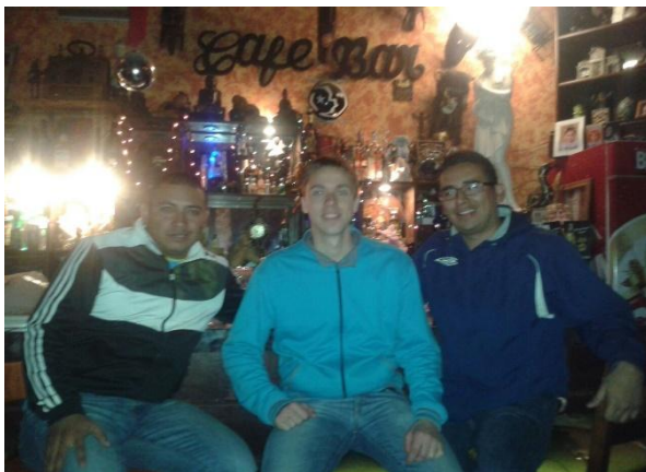
Ég með félögum mínum í Guatemala City