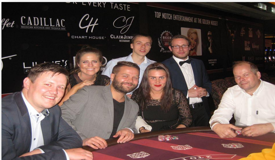
Slakað á eftir mót á Golden Nugget