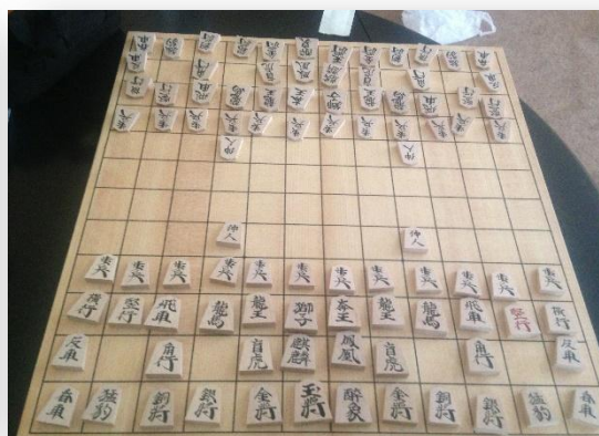
Félagi minn kenndi mér að spila japanska skák, Shogi