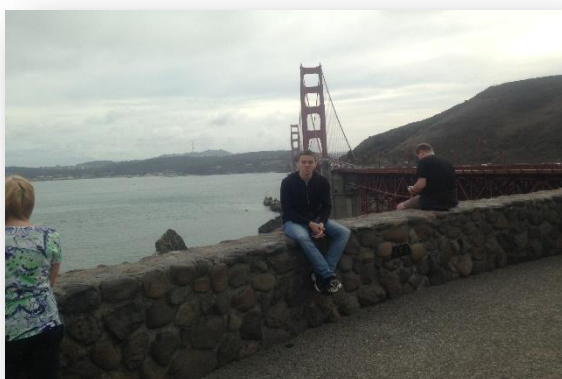
Golden Gate Bridge í San Fransisco