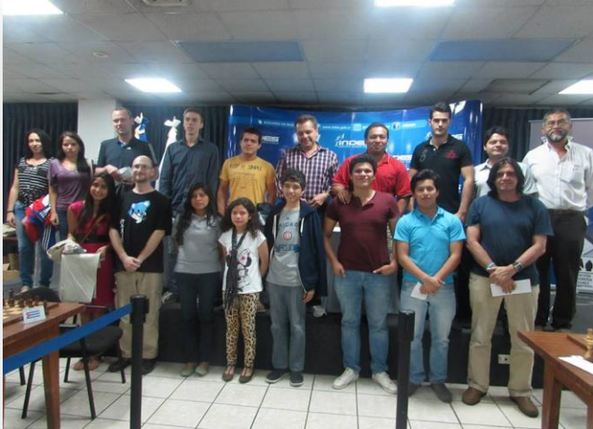
Verðlaunahafar í San Salvador Open