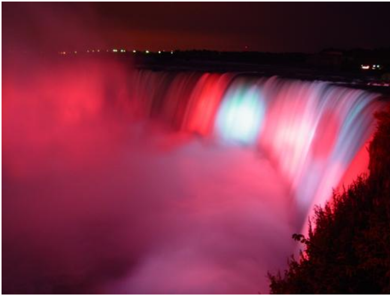
Níagara fossar að kvöldi til

Eftir mótið fór ég til Kosta Ríka og var heppinn að fá einn dag í Toronto áður þar sem ég fór að skoða Níagara fossa.