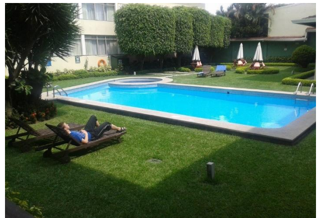
Slakað á fyrir skák