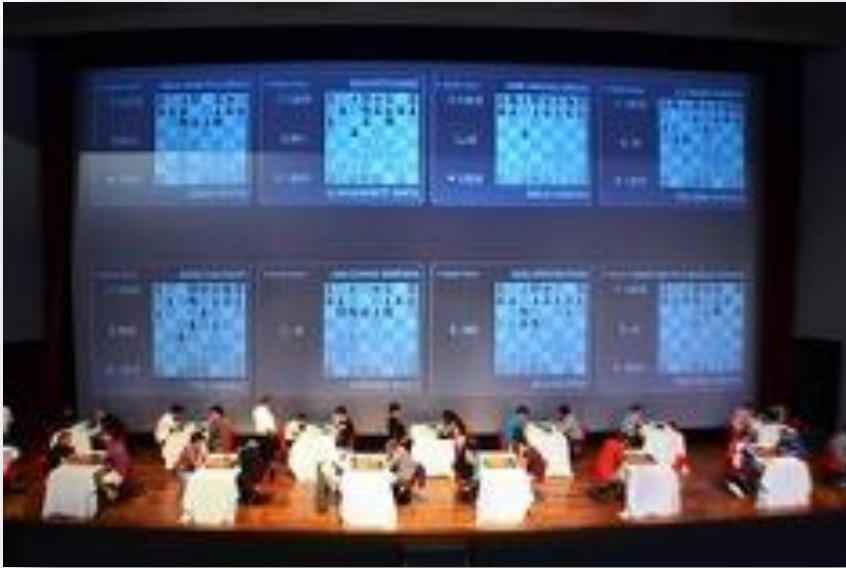
Carlos Torre Memorial 2014